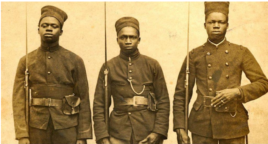
Fot. 2. Strzelcy Senegalscy

Był to okres odrodzenia populacji francuskiej, ale wybuch pierwszej wojny światowej spowodował oczywiste spustoszenia całych regionów północnej i wschodniej Francji. Aby poradzić sobie z tą trudną sytuacją, władze francuskie zwróciły się ku imperium kolonialnemu. W ten sposób w 1914 roku tysiące młodych rekrutów wylądowało we Francji, wśród nich także senegalscy żołnierze. W 1857 roku Korpus Strzelców Senegalskich został utworzony przez Louis Faidherbe, gubernatora generalnego Francuskiej Afryki Zachodniej. Żołnierze z tej jednostki zostali określani mianem Strzelców Senegalskich ( Les Tirailleurs Sénégalais ), nie pochodzili tylko z Senegal, również ze wszystkich francuskich kolonii w Afryce. Już w sierpniu 1914 roku 31.000 z nich walczyło na frontach pierwszej wojny światowej w szeregach armii francuskiej.